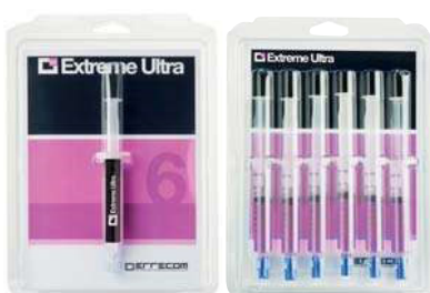
1/4 SAE (A)

** 80x120xH200 cm (31,50x47,25xH78,75 inch.)